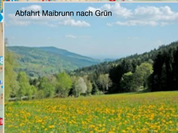
Abfahrt Maibrunn nach Grün